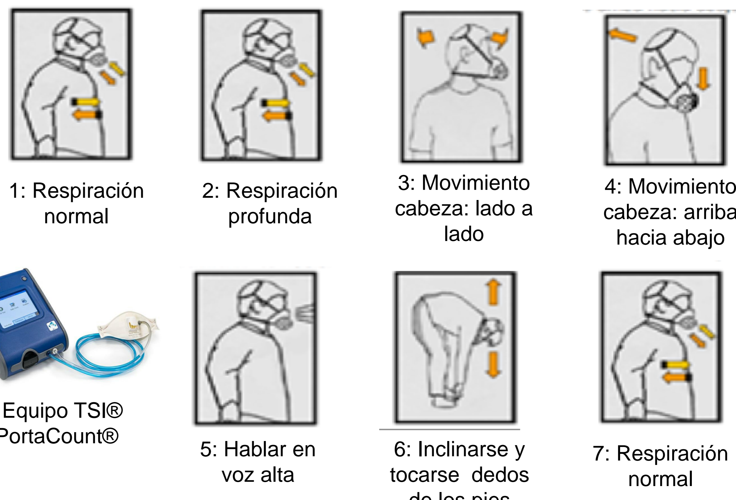
Figura 1: Actividades a realizar durante la prueba de ajuste

La prueba de ajuste se hizo con tres personas con dimensiones faciales diferentes y que cuentan con amplia experiencia en la realización de esta prueba. Se hicieron pruebas con total de 38 modelos de mascarillas autofiltrantes que corresponden a 29 marcas diferentes.