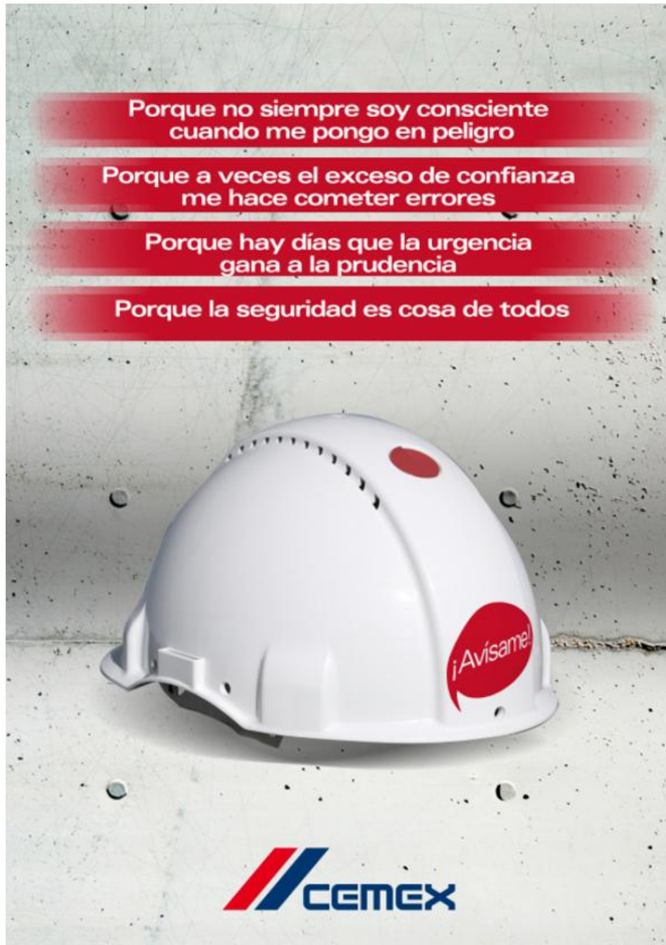
Cartel 4 Revelador de la campaña