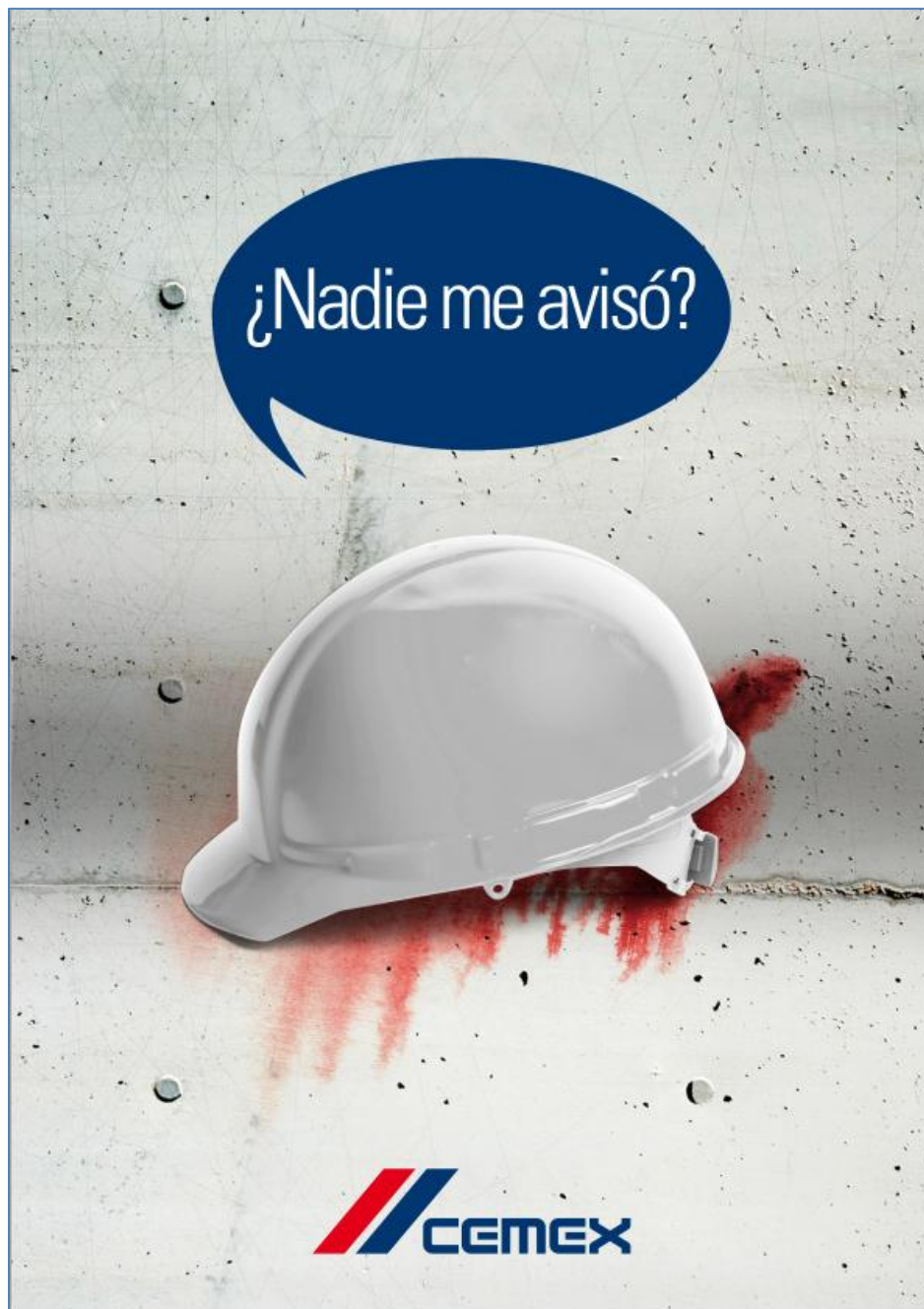
Cartel 1 fase teaser