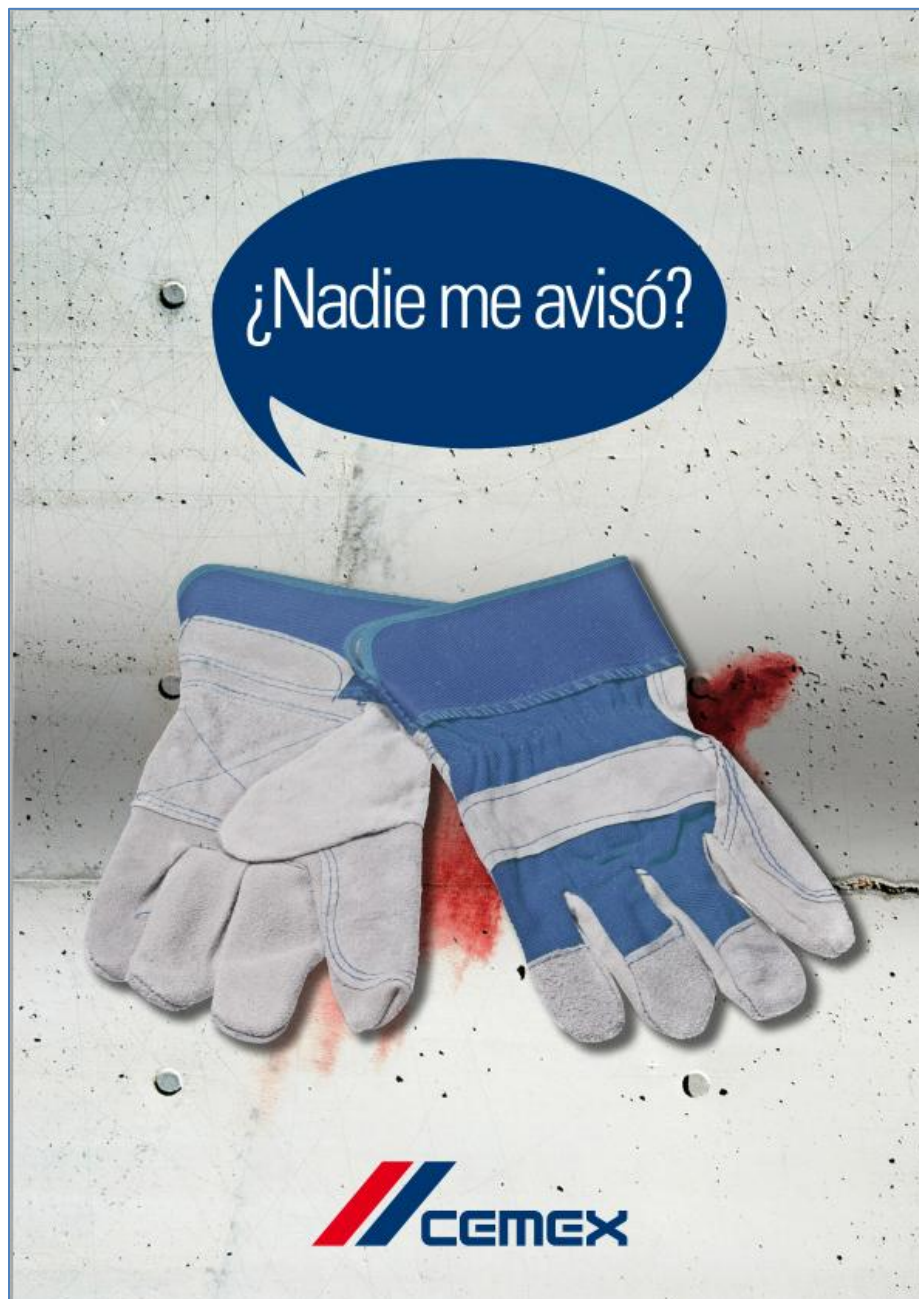
Cartel 3 fase teaser