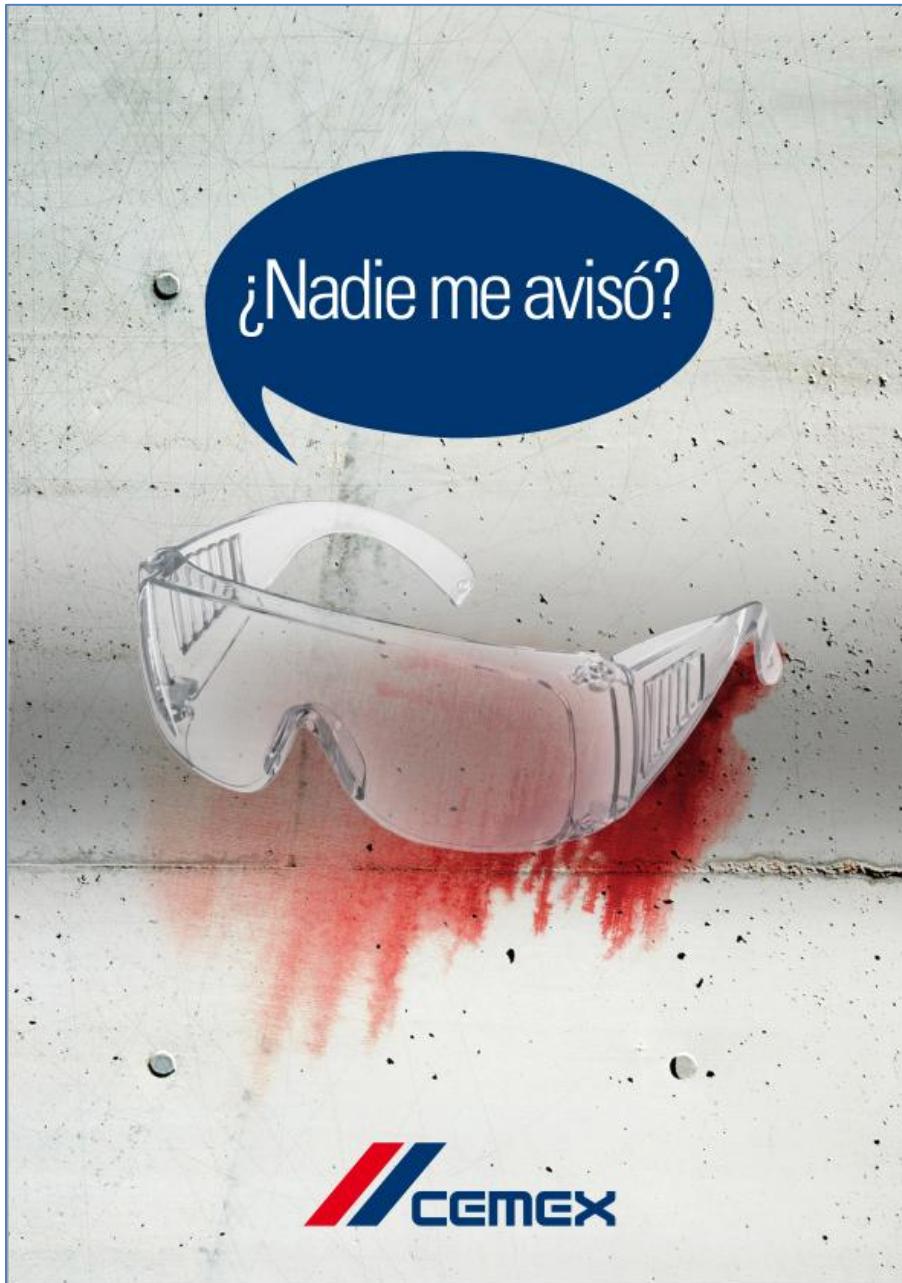
Cartel 2 Fase teaser