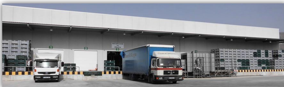
Figura 2. Muelles de descarga.

Actualmente, la empresa tiene por actividad principal, el manipulado y comercialización al por mayor de frutas, cítricos y uva de mesa. Destinando, la mayor parte de su producción a la exportación.