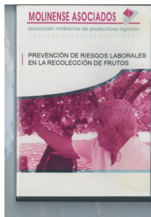
Figura 7. DVD PRL. Recolección