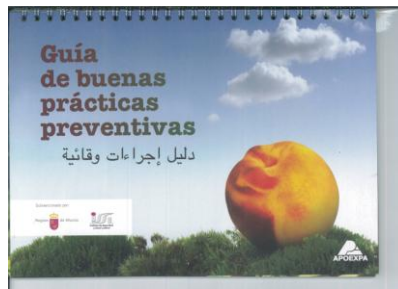
Figura 12. Guía de buenas prácticas preventivas

Coordinado por la Asociación Agraria de Jóvenes Agricultores (ASAJA), y en colaboración con la entidad formativa Grupo Edefor, S.A.T. BLANCASOL participa en el diseño y elaboración, de dos tipos de manuales utilizados frecuentemente en acciones formativas en el sector agroalimentario: