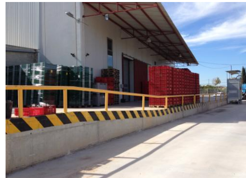
Figura 19. Protección anti caída