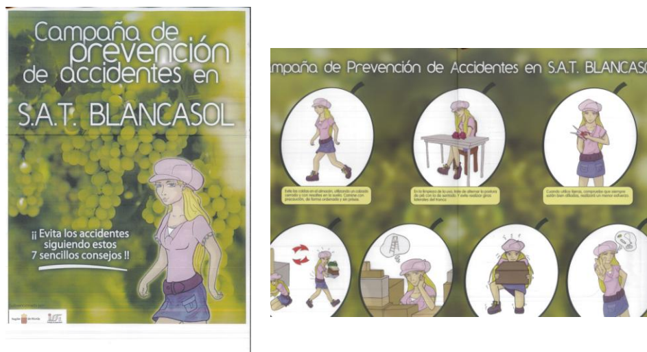
Figura 11. Folletos de la campaña de Prevención

Para involucrar aún más a los trabajadores en esta iniciativa, y hacerlos partícipes de este proyecto, los dibujos que aparecen en los folletos, han sido seleccionados de entre los dibujos realizados por los hijos de los empleados de S.A.T. BLANCASOL, realizando previamente una campaña de información y sensibilización en la empresa, y así conseguir una mayor participación.