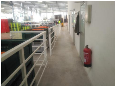
Figura 18. Protección de atropellos para peones