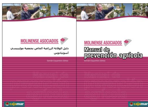
Figura 10. Manual de Prevención Agrario

Como en el caso de los audiovisuales, S.A.T. BLANCASOL también ha participado en el seno de la Asociación Molinense de Productores Agrarios en la edición y divulgación de Manuales de Prevención.