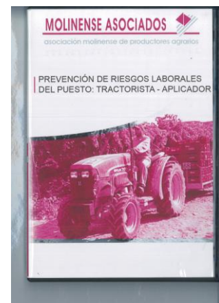
Figura 8. DVD PRL. Tractorista