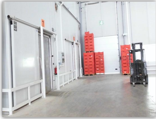
Figura 3. Imagen de cámaras frigoríficas