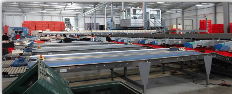
Figura 15. Imagen de calibrador automático

Con el objeto de paliar o disminuir estos riesgos en S.A.T. BLANCASOL, y mejorar la productividad, durante el año 2014, se realizó una inversión en equipos de trabajo superior a 1.000.000 €. Dicha inversión consistió fundamentalmente, en la instalación de calibradores automáticos, que redujeron sustancialmente las tareas manuales de tría y selección de productos, con la consiguiente disminución del riesgo por movimientos repetitivos en manos y muñecas.