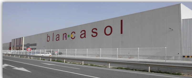
Figura 1. Fachada principal de la entidad

Con la denominación de Sociedad Agraria de Transformación BLANCASOL, la empresa inicia su actividad en el año 1982, en unas instalaciones de 1.000 m 2 , para la manipulación de fruta en fresco y dos cámaras frigoríficas, dichas instalaciones se encuentran ubicadas en el municipio murciano de Blanca, concretamente en la pedanía de la Estación de Blanca. En su origen, tan sólo se disponía de una maquinaria semiautomática para el calibrado de la fruta. En la actualidad, manteniendo la misma razón y domicilio social, la entidad cuenta con una superficie de naves superior a 12.000 m 2 , ocho cámaras frigoríficas para conservar la fruta y cítricos entre 7°C y 4°C. Un elevado nivel de tecnificación, fruto de una continua inversión en maquinaria y un promedio anual de 330 trabajadores.