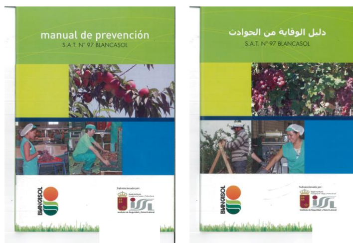
Figura 9. Manual de PRL específico S.A.T. BLANCASOL

Para la edición y distribución del manual de prevención, se desarrolló un análisis de la accidentabilidad interna de la empresa y un estudio pormenorizado de las evaluaciones de riesgos, con el objeto de elaborar un “mapa de riesgos propio de la empresa”.