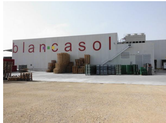
Figura 4. Fachada principal de la entidad