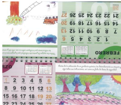
Figura 14. Extracto de almanaque realizado

Los mensajes reflejados en el almanaque, han sido elaborados una vez analizadas las evaluaciones de riesgos de S.A.T. BLANCASOL y la de sus socios. Los dibujos, han sido realizados por los hijos de los trabajadores, tras pasar un proceso de selección.