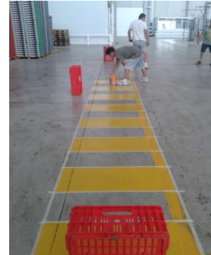
Figura 17. Imagen de señalización