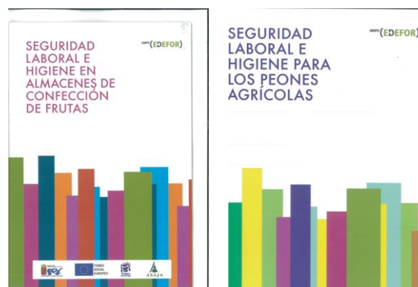
Figura 13. Manuales de Prevención