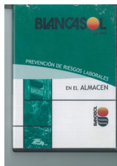
Figura 5. DVD prevención S.A.T. BLANCASOL

En la actualidad, a los trabajadores de nueva incorporación, se les proyecta el video en su primer día de trabajo, lo que unido a las explicaciones del formador, constituye una formación suficiente y adecuada en seguridad y salud laboral.