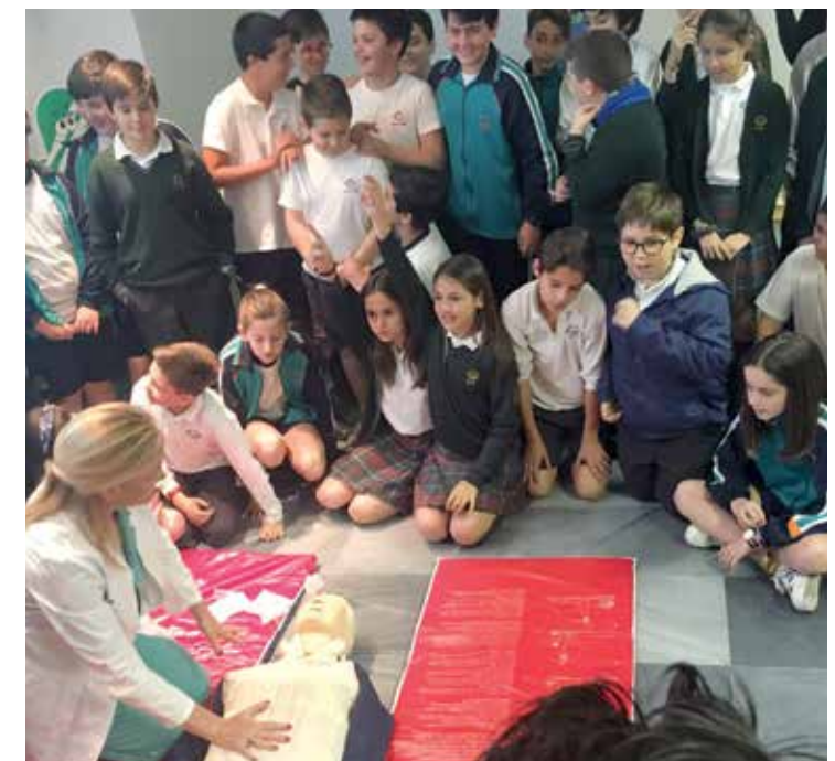
Fraternidad-Muprespa lleva la prevención a las escuelas

Con este fin y con el objeto de extender la cultura preventiva a toda la sociedad, Fraternidad-Muprespa quiere incentivar las medidas orientadas a la concienciación, sensibilización y difusión de la prevención de riesgos laborales con un mayor énfasis, centradas en las actividades de la Semana de la Prevención.