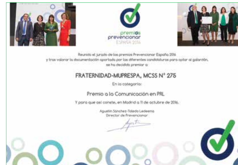
Fraternidad-Muprespa MCSS nº 275 Premio a la Comunicación en PRL

Por último queremos agradecer a todas y cada una de las 85 entidades que han participado en esta V Edición de los premios Escolástico Zaldívar por sus excelentes memorias, con las que fomentan las buenas prácticas preventivas y nos permiten, con su generosidad, hacerlas públicas para toda la sociedad.