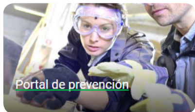
Portal de prevención

Desde nuestra web www.fraternidad.com se accede al Aula Prevención a través del Portal de Prevención situado en la parte inferior.