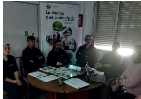
LA RIOJA Charla 'Sensibilización para mandos intermedios'. Empresa: MINERAQUA.