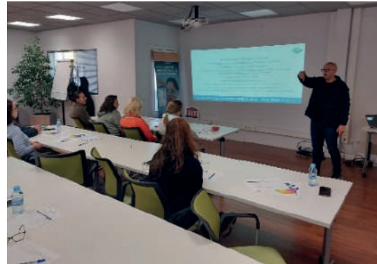
BARCELONA Taller Fitness Emocional. Empresa: INEOS COMPOSITES HISPANIA