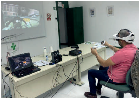
BADAJOS Taller de seguridad vial. Empresa: AQUANEX