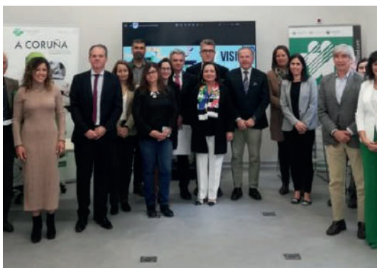
CORUÑA Acto entrega distintivo Cero Accidentes. Varias empresas