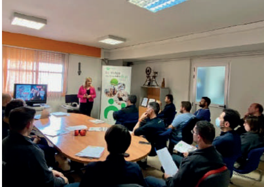
BURGOS Taller de 'Percepción de riesgos e identificación de peligros. Empresa: GEISA FABRICS