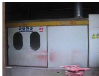
Identificación de riesgos