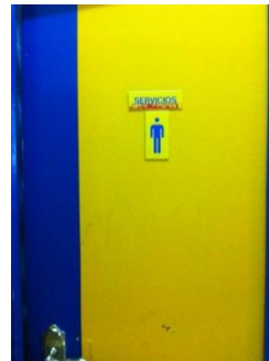
Identificación de espacios