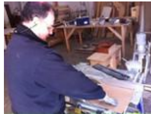
Equipo de trabajo