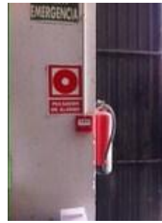
Identificación de extintores