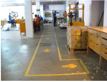
Flujo de recorrido