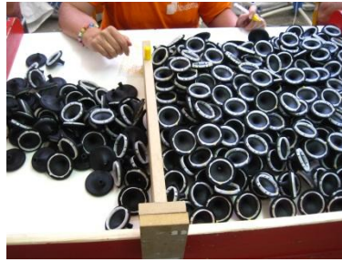
Separador de mesa