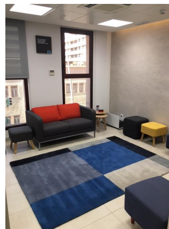
Nuevo espacio de trabajo del departamento de RR.HH, en Servicios Centrales, Plaza Barcelona, Almería.