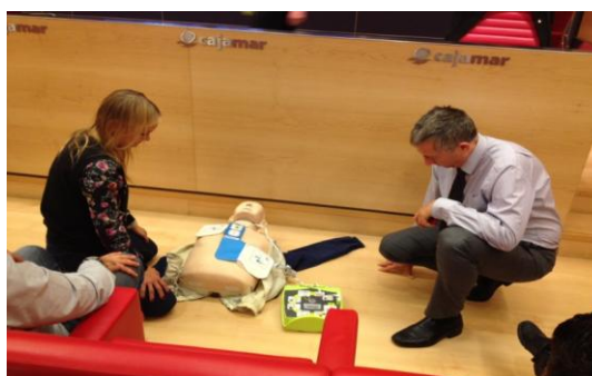
Actividad formativa de reciclaje (bienal) en el uso del Desfibrilador, Sede Almería.