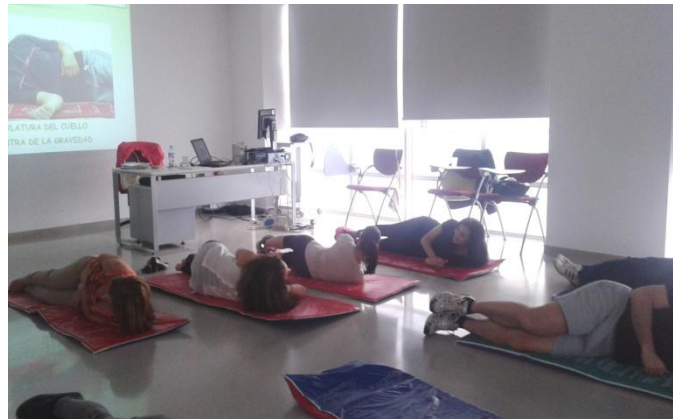
Taller de Escuela de Espalda celebrado en la Sede de Almería.