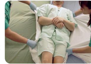
1) De cama a camilla