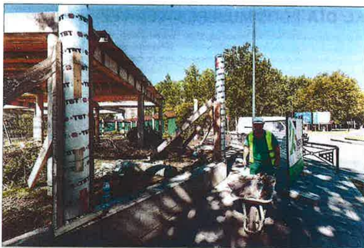
Reparan la valla 'empotrada' de San Amaro. Tres meses y medio después del espectacular accidente que acabó con un vehículo todoterreno empotrado contra la valla de las piscinas de San Amaro en la mañana del 19 de febrero, el Ayuntamiento de Burgos inició ayer su reparación. De esta forma el recinto estará listo para recibir la próxima temporada de verano.

Sofocan un incendio en Burgullaser Los trabajadores de Burgullaser (empresa del polígono de Villalonquéjar) y los bomberos de Burgos sofocaron ayer un incendio en una de sus máquinas, un filtro del sistema de aspiración que se reactivó por causas que se desconocen. Como se encontraba en un lugar aislado el fuego no se extendió a la planta.