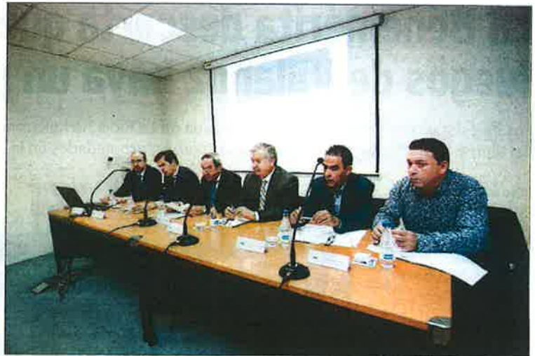
Patronal y sindicatos, contra las adicciones. La Confederación de Asociaciones Empresariales de Burgos (FAE), Proyecto Hombre y las fundaciones de Cajacirculo e Ibercaja, con el apoyo de UGT y CC OO, presentaron el programa 'Prevención de adicciones en el ámbito laboral' orientado a combatir el consumo de drogas legales o ilegales en el puesto de trabajo y sus riesgos.

La Prueba de Acceso a Enseñanzas Universitarias (PAEU), antes denominada selectividad, se realizará en Burgos del 14 al 16 de junio y del 12 al 14 de septiembre, en este caso para quienes suspendan alguno de los exámenes. La primera jornada se presenta a los alumnos y las pruebas tendrán lugar a las 9.30, 11.45 y 16.15 horas, y los dos siguientes a las 8.15, 10.30, 16.30 y 18.45 horas.