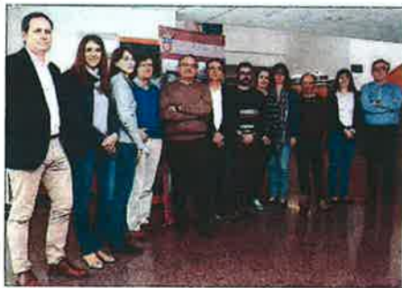
Los integrantes del GIE de la Universidad de Burgos.

Entre las ventajas de estos morteros, los investigadores subrayan la importancia de la reutilización de los residuos de la industria del acero.