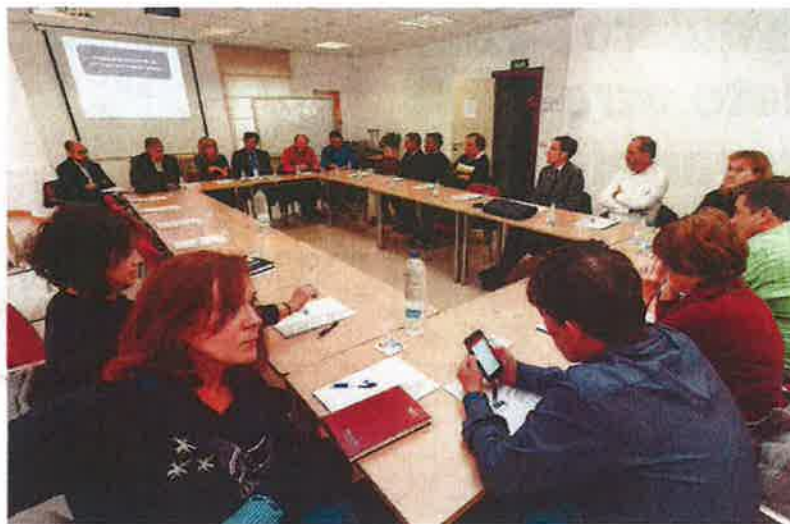
Una docena de empresarios acudió a la jornada organizada por FAE.