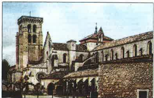
Perspectiva real del monasterio desde la calle Alfonso VIII.