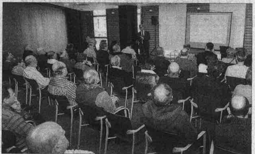
Alrededor de 65 personas acudieron al encuentro celebrado en dependencias de la entidad.

El objetivo de la entidad con estos encuentros que se han pro-