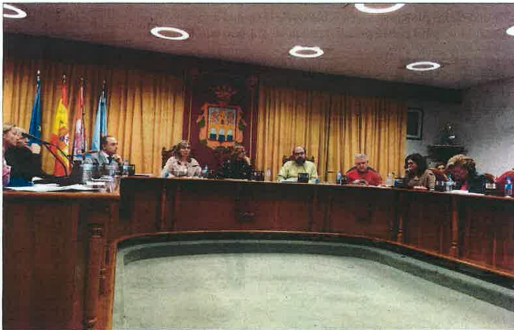
El pleno aprobó por unanimidad dos de las mociones presentadas, una para exigir un pago a la Junta y la otra, del Partido Socialista, sobre violencia machista. / DS