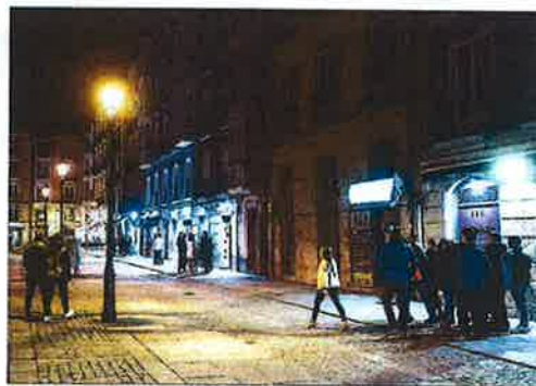
El suceso se produjo en la calle de Huerto del Rey.

• La víctima sufrió un traumatismo craneoencefálico al caer al suelo tras recibir varios puñetazos. El lunes pasado le dieron el alta y ya está en casa.