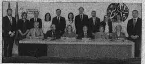
Junta directiva del Colegio. ecb

«Será necesario conseguir apoyos de las administraciones sanitarias, ayuntamientos, diputaciones, mutuas y asociaciones de paciente. Es importante poner en valor el papel sanitario que ejercen las oficinas de farmacia en una provincia como la nuestra, donde el farmacéutico en ocasiones, es el único profesional sanitario en muchos de nuestros pueblos y donde el número de farmacias por habitante es mucho mayor que la media na-