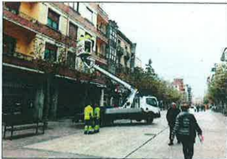
Los operarios trabajaban ayer en la calle de La Estación.

La feria navideña será uno de los actos iniciales vinculados a la Navidad en la ciudad, y se realiza este fin de semana ya que se trata de una feria principalmente destinada a la oferta de objetos de decoración navideña. Las casetas ya se han instalado en la calle de La Estación, en la zona peatonal entre Francisco Cantera y El Cid, y estarán abiertas mañana y el domingo.