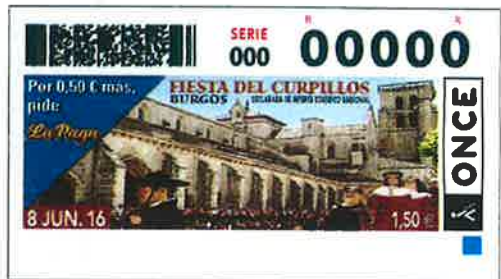
Imagen oficial del cupón, distribuida por la ONCE.