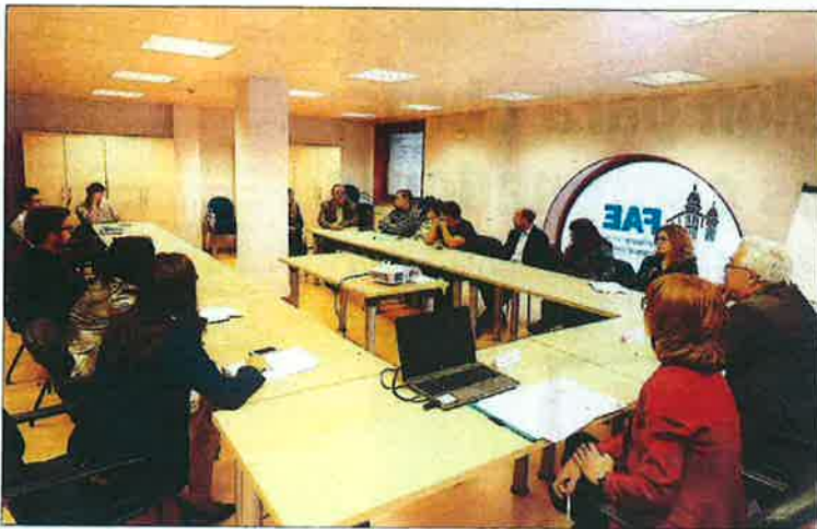
La jornada se celebró en la sede de la Federación de Asociaciones Empresariales.

SOCIEDAD | PROGRAMA DE PREVENCIÓN Y CONCIENCIACIÓN