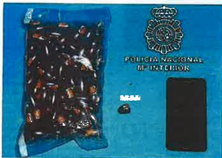
El kilo de hachís estaba distribuido en numerosas bellotas.