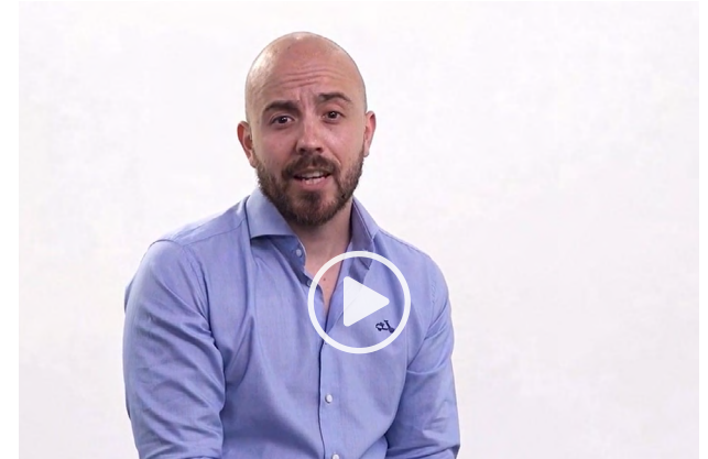
¿Cómo afecta la discriminación a nuestra salud mental?