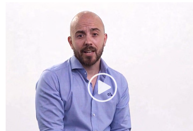
Concepto de Diversidad