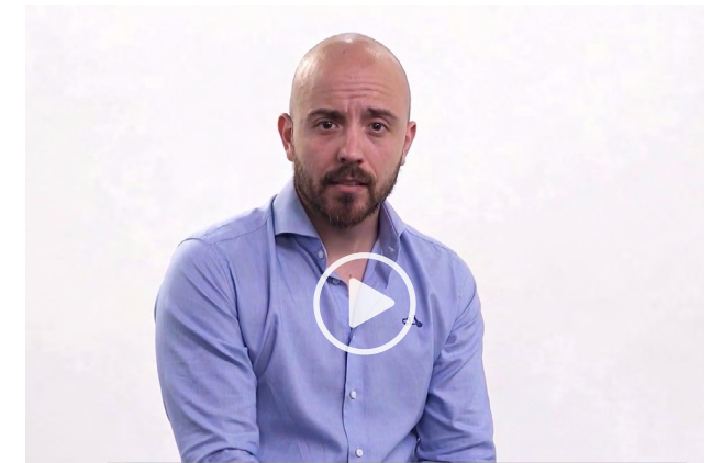
Planes de igualdad empresariales