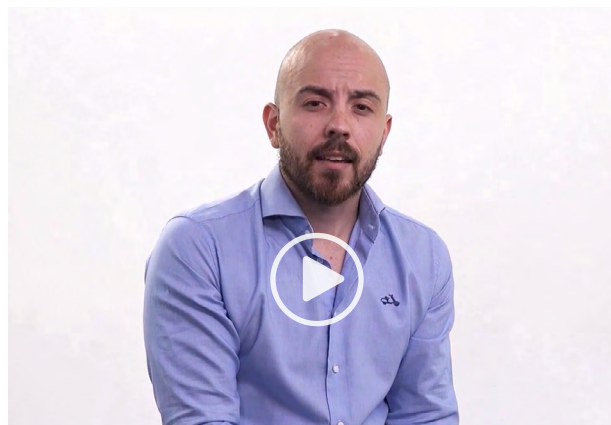
Tipos de discriminación laboral

Niega oportunidades a las personas, impide que se aproveche el talento humano y merma el progreso económico.