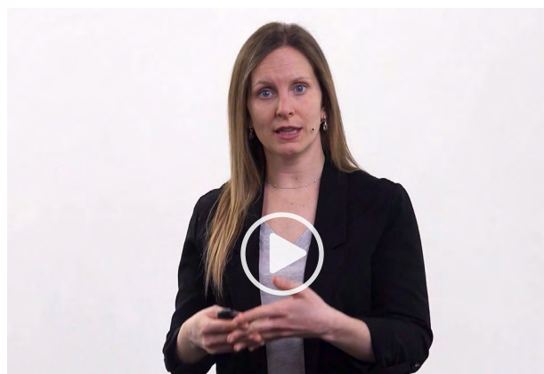
¿Qué entendemos por Igualdad?

Garantizar la igualdad, la diversidad o pluralidad y la inclusión es un reflejo de nuestra identidad como sociedad avanzada