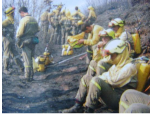
Foto 6. P.E.E.I.F. en descanso portando EPI y mochila extintora.