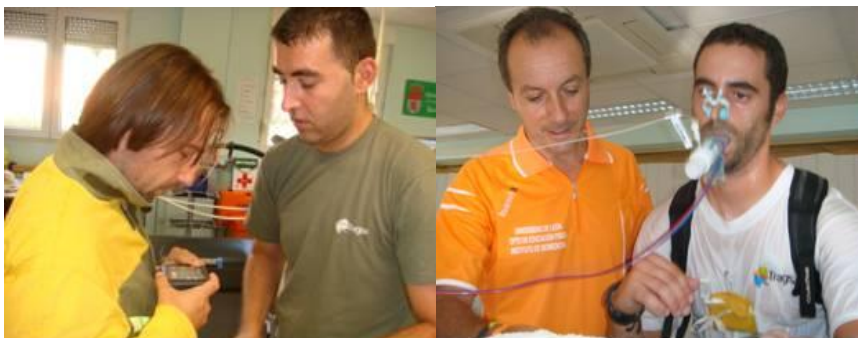
Foto 12. P.E.E.I.F. sometido en laboratorio a prueba de esfuerzo a 30°C y 30% de humedad relativa durante 2 horas analizándose temperatura central y tasa de sudoración.

indica una elevación desproporcionada del ritmo cardíaco, y en segundo lugar por el deterioro funcional de músculos y tendones, debido a que el aumento de temperatura muscular altera la estructura normal de las proteínas contráctiles y del colágeno, con riesgo de lesiones musculotendinosas. Además, deshidrataciones del 3% del peso corporal puede estar en la génesis de contracturas y calambres musculares, junto a un aumento del riesgo de lipotimia; si llegan al 5% hay mayor riesgo de lesiones musculotendinosas; deshidrataciones del 8% del peso corporal provoca la contracción sostenida del músculo sin posibilidad de relajación; y del 10% comportan un riesgo vital (Barbany, 2002; McArdle y cols., 2001;González Alonso y cols., 1995; Maughan y Gleeson, 2004).