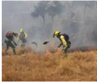
Foto 4. P.E.E.I.F. trabajando con batefuegos en ataque directo.