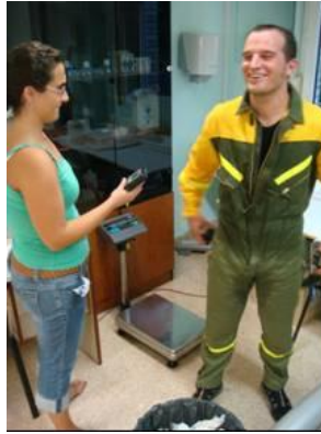
Foto 13. P.E.E.I.F. del proyecto CREIF sometido a prueba de esfuerzo con monitorización de transferencia de temperatura y valoración de tasa de sudoración inducido por el EPI.