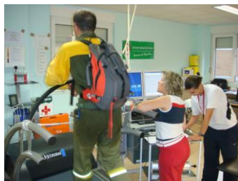
Foto 11. Prueba de esfuerzo en el laboratorio de valoración de la condición física para análisis de la tensión fisiológica y el estrés térmico inducida por los tipos de EPI.

llega a incrementar la FC y el VO_2 un 11% y 17% cuando se compara correr a 7 km/h con EPI o en camiseta y pantalones de deporte en pruebas de bomberos de estructuras (Baker y cols, 2000). El aislamiento térmico que la ropa ofrece al intercambio de calor (representado por I_{cl} o R_{tc} ) depende del espesor de las capas de tejido y de la naturaleza propia del mismo. No obstante, el EPI usado por el P.E.E.I.F. no parece tan restrictivo en cuanto al intercambio de calor (Budd, 2001), ya sea exterior o bien generado por el metabolismo, ya que alcanza un nivel de aislamiento térmico de 1,21 Clo (Raimundo y Figueiredo, 2006), mientras que el EPI utilizado por bomberos de estructuras alcanza los 3 Clo (Goldman, 1990; Taylor, 2006).