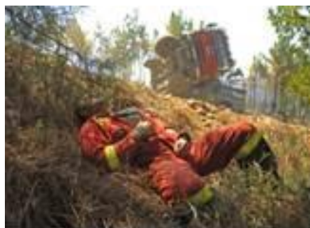
Foto 2. P.E.E.I.F. con traumatismo laboral