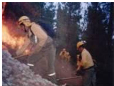
Foto 3. P.E.E.I.F. trabajando en pendientes y condiciones adversas.

El trabajo del P.E.E.I.F. en el dispositivo de extinción está subordinado al comportamiento del fuego (Martínez, 2000) el cual está supeditado tanto al tipo de formación vegetal, de la que dependerá la inflamabilidad (Elvira y Hernando, 1989) y la combustibilidad del mismo (Anderson, 1982; Rothermel, 1983), como a factores topográficos (la pendiente) (Mérida, 2000) y factores no controlables por el hombre, aunque sí predecibles, como las condiciones ambientales: temperatura, humedad relativa del aire, y velocidad del viento (Rothermel, 1983; Trabaud, 1992).