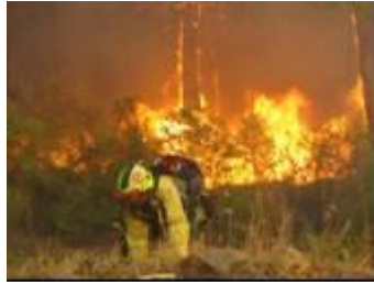
Foto 10. P.E.E.I.F. expuesto a temperaturas extremas