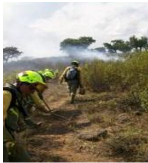
Foto 5. P.E.E.I.F. trabajando en ataque Indirecto con herramientas de raspado para crear una línea de defensa.

El Método de Ataque Indirecto se emplea cuando existe riesgo excesivo para el P.E.E.I.F., bien porque la propagación del fuego sea rápida, exista peligro de focos secundarios (Martínez, 2002), la topografía sea abrupta y la vegetación densa (Aguirre y cols., 2006), o el calor y el humo desprendido por el fuego impiden el trabajo próximo a las llamas (Hendrie y cols., 1997). Este método consiste en aislar el combustible de las llamas, eliminándolo en fajas de anchura variable hasta el dejar al descubierto el suelo mineral (“crear líneas de defensa”) empleando para ello herramientas de corte, raspado o cavado; o bien impregnado el combustible con productos químicos que retardan o impiden la combustión del material vegetal, llamados cortafuegos químicos (Martínez, 2002).