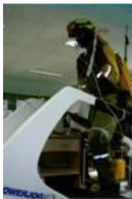
Foto 1. P.E.E.I.F. realizando prueba de esfuerzo en tapiz rodante en Laboratorio de Valoración de la Condición Física de la Universidad de León.

Tabla 1. Objetivos generales del Proyecto I+D+i CREIF “Estudio de los factores condicionantes del rendimiento del P.E.E.I.F. de las Empresas TRAGSA y Mutua Fraternidad, al que se ha incorporado la Empresa EGMASA, con el apoyo de del Ministerio de Medio Ambiente y Medio Rural y Marino, Junta de Comunidades de Castilla la Mancha, y en colaboración par su desarrollo con la Universidad de León (Grupo de Investigación VALFIS del Dpto de Educación Física y Deportiva y el Instituto de Biomedicina).