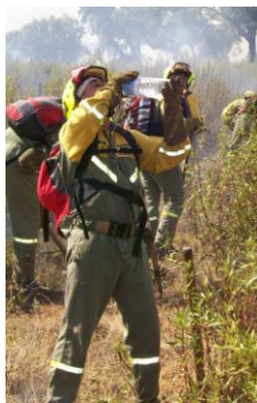
Foto 9. P.E.E.I.F. con necesidad de rehidratación