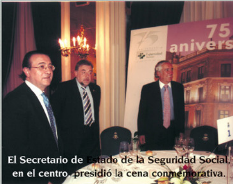
El Secretario de Estado de la Seguridad Social, en el centro, presidió la cena conmemorativa.

16%) y expuso los actos que se iban a desarrollar durante todo el mes. El primero de ellos fue la