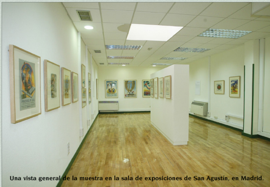
Una vista general de la muestra en la sala de exposiciones de San Agustín, en Madrid.

viación de riesgos laborales, desde la cartilla de hace siglos a la página web de hoy. El artículo abunda en referencias históricas y bibliográficas desde el Quinientos y la irrupción de la imprenta, aunque el autor reconoce que no se puede hablar de publicidad hasta que no se desarrolla el consumo de masas en los años veinte del S.XX.