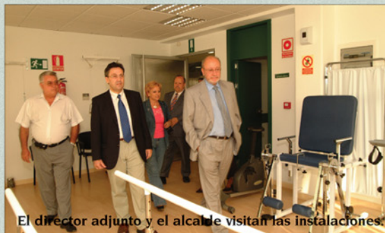
El director adjunto y el alcalde visitan las instalaciones.

El 30 de septiembre, FRATERNIDAD MUPRESPA ha inaugurado en San Sebastián de los Reyes (Madrid) una nueva oficina y un centro asistencial. Las instalaciones comprenden un edificio de dos plantas destinado a oficina administrativa, un centro médico asistencial y de rehabilitación, y el servicio de prevención ajeno, con una superficie total de 1.600 metros cuadrados,