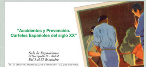
"Accidentes y Prevención. Carteles Españoles del siglo XX"