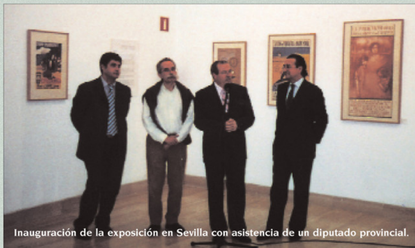
Inauguración de la exposición en Sevilla con asistencia de un diputado provincial.