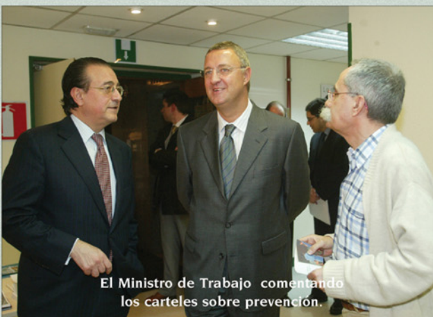
El Ministro de Trabajo comentando los carteles sobre prevención.

Esta muestra de carteles publicitarios sobre accidentes y prevención, información y protección al trabajador y al ciudadano, es una