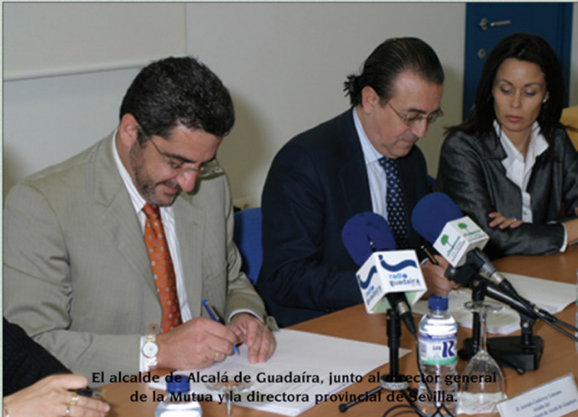
El alcalde de Alcalá de Guadaíra, junto al director general de la Mutua y la directora provincial de Sevilla.