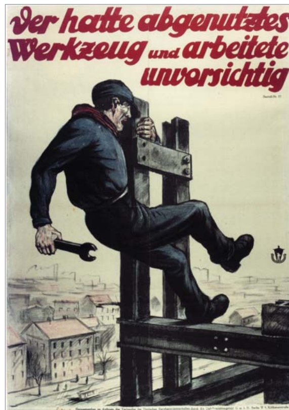
Extraído del libro DANGER. Autor: desconocido. Berlín (Alemania). 1925-1937. "Él tenía las herramientas deterioradas y trabajaba sin tomar precauciones".

jo, falta de ropa adecuada, alimentación deficiente... En cuanto a los problemas del estrés y a la tensión nerviosa, una encuesta realizada por la rama femenina de la JOC, entre las domésticas en Francia, señalaba que el 55 por ciento de las chicas se encuentran fatigadas, el 58 por ciento decía sentirse nerviosas 38 . En este punto, una serie de artículos de carácter médico, aparecidos en la revista Información Española a lo largo de 1974, se referían a los infartos y las úlceras de estómago. Se trataba de enfermedades