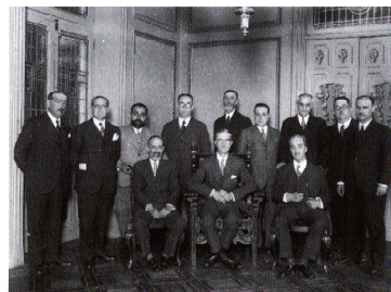
Los inspectores regionales del trabajo con el Ministro de Trabajo (centro), Pedro Sangro y Ros de Olano. 1930.