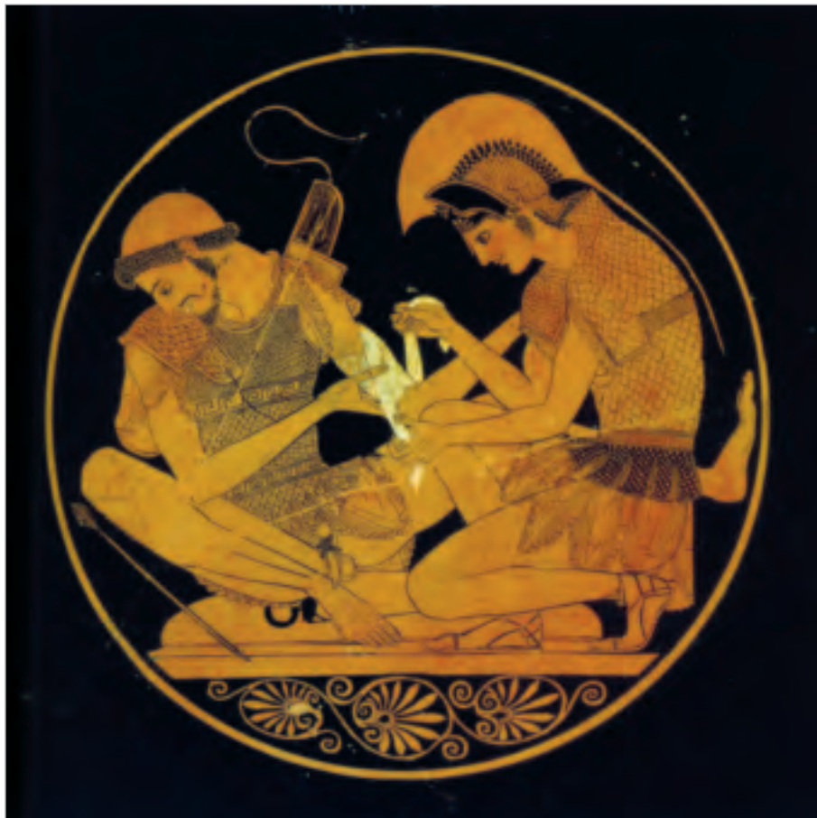
Aquiles vendando a Patroclo. Copa de Sosia. Museen zu Berlin.