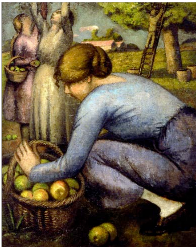
La recolección de las manzanas, 1920-25. Julio González. Colecciones del Estado MNCARS.