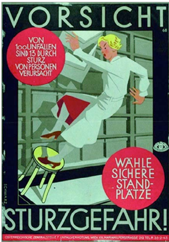
Vorsicht sturzgefahr!. [¡Atención, peligro de caída!]. Schwarz Viena, Austria. Entidad: Unfallverhütung.

El tema dominante de la colección se inscribe dentro de la preocupación de los países más industrializados por el cuidado de las lesiones laborales, la indemnización por incapacidad o defunción, y la prevención de riesgos labora-