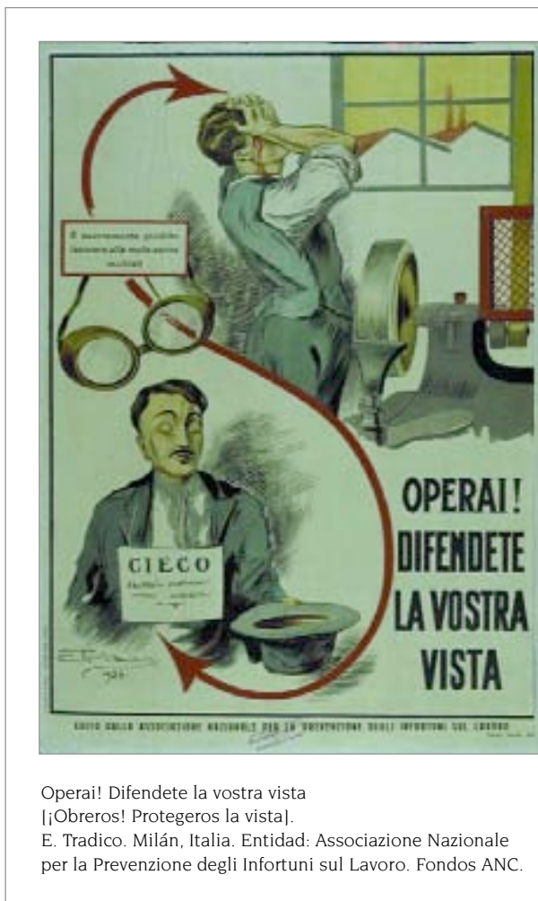
Operai! Difendete la vostra vista [¡Obreros! Protegeros la vista]. E. Tradico. Milán, Italia. Entidad: Associazione Nazionale per la Prevenzione degli Infortuni sul Lavoro. Fondos ANC.

Si expertos actuales en prevención hacen un estudio comparativo de los agentes materiales de daños de ayer y de hoy, así como de los daños, las medidas de prevención y los tipos de accidentes del siglo pasado y del actual, no sé si