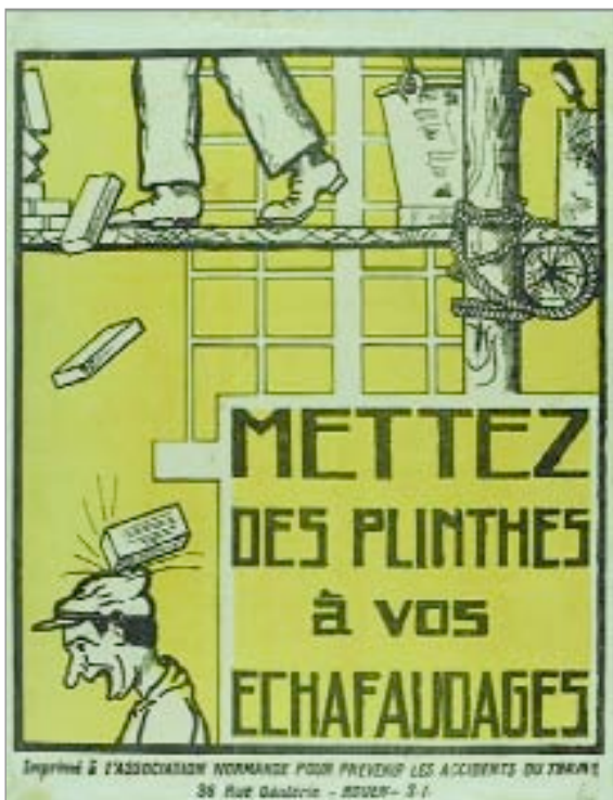
Mettez des plinthes à vos échafaudages [Poned zócalos a los andamios]. Desconocido. Rouen, Francia. Entidad: Association Normande pour Prévenir les Accidents du Travail.

Por nuestra parte, en el ANC la solicitud de información y reproducciones de la Colección de carteles de accidentes laborales no ha cesado desde que en 1998 iniciamos su difusión.