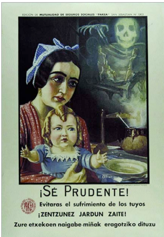
¡Sé Prudente! Evitarás el sufrimiento de los tuyos. H. Oñativio. San Sebastián. País Vasco. Entidad: Mutualidad de Seguros Sociales "Pakea". Fondos ANC.

expusieron tanto los carteles nacionales que participaban en el concurso como la colección de carteles internacionales. En total, cerca de un millar.