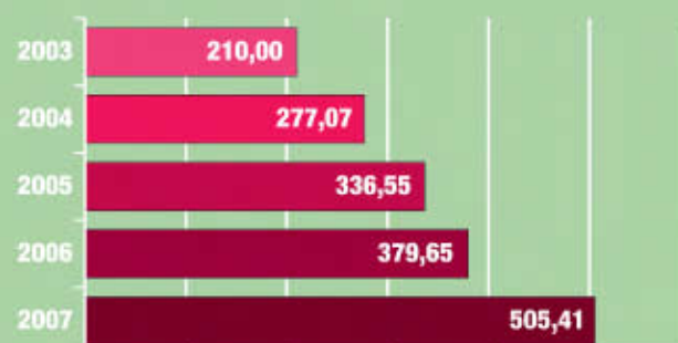
EVOLUCIÓN RESERVAS (en M€)