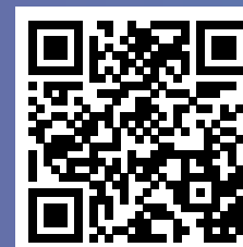
Portal del emprendedor fraternidad.com